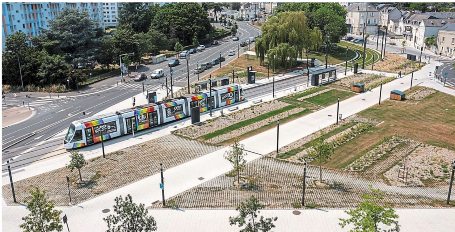
Angers, place Maurice-de-Farcy, 15 juin 2023. Entre les résidences Montesquieu et l'étang Saint-Nicolas, cet espace est celui qui a été le plus généreusement végétalisé avant l'arrivée du tramway.